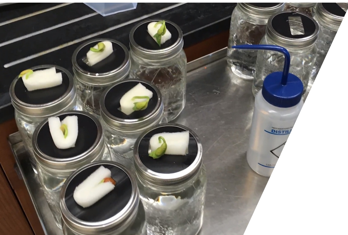
La serre portable utilise des bocaux Mason comme jardinières.